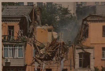
Wybuch butli z gazem w budynku mieszkalnym

Znajomość zasad ewakuacji ułatwia rozważne działanie, nieuleganie panice, udzielanie pomocy osobom potrzebującym, a także zapobieganie chaosowi.